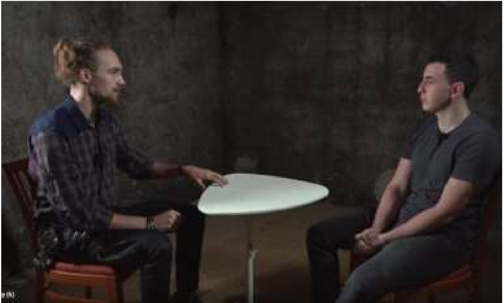
Foto z reportáže v rámci semináře Open Space